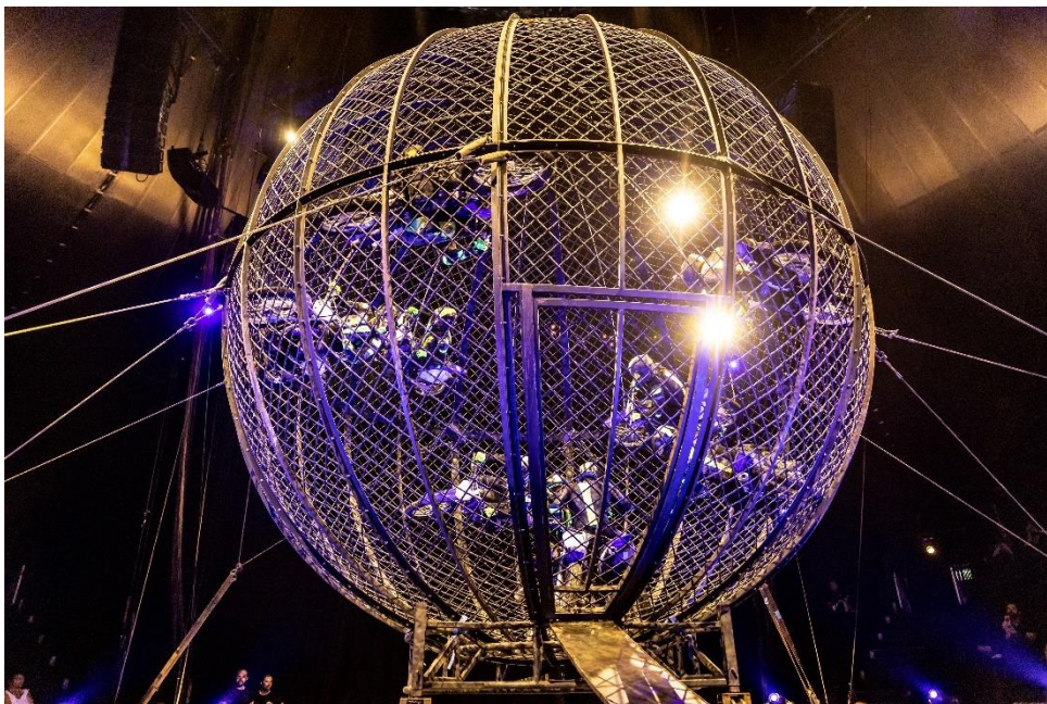
Bildunterschrift: Die Helldrivers im Globe of Speed – eine Tradition bei Flic Flac

Die folgenden Bilder stehen hier zum Download zur Verfügung: https://we.tl/t-dKDGnoR93K Weiteres Bildmaterial können Sie unter presse@smic-marketing.de anfordern.