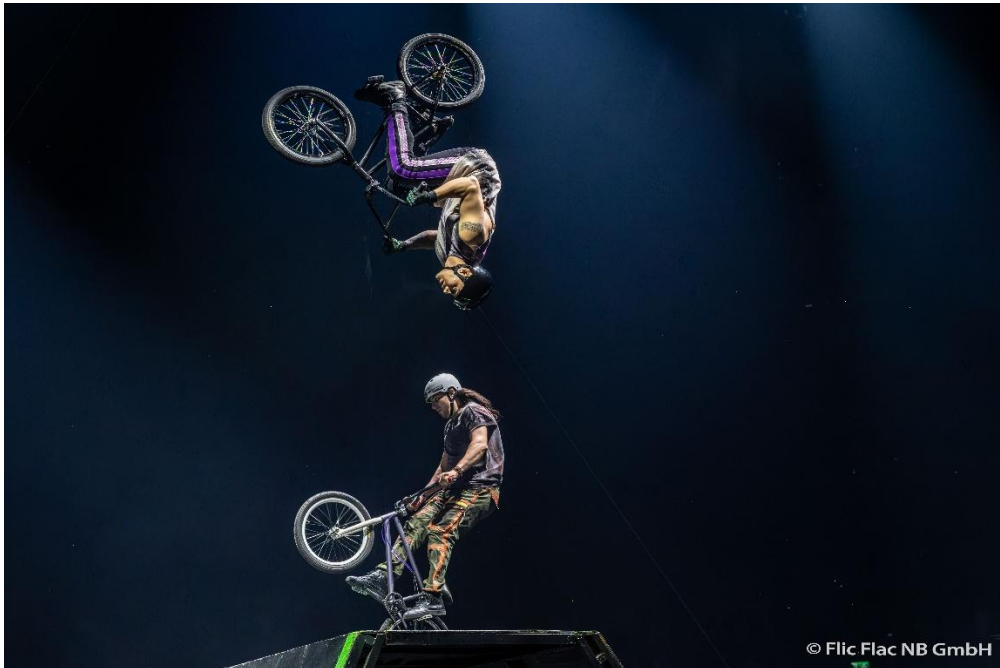
Bildunterschrift: Atemberaubende BMX-Stunts