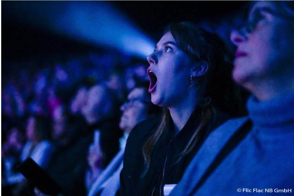
Bildunterschrift: Manche Zuschauer konnten nicht glauben, was sie sahen