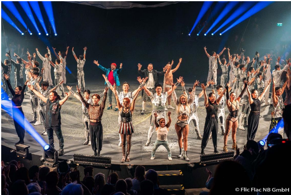
Bildunterschrift: Alle Artisten der X-Mas Show 2024/2025 in Nürnberg beim Finale

Die folgenden Bilder stehen hier zum Download zur Verfügung: https://we.tl/t-3TICiHwWVM Weiteres Bildmaterial können Sie unter presse@smic-marketing.de anfordern.